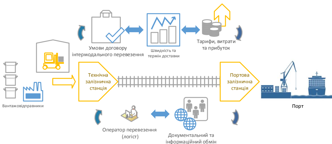
Рис. 2. Структурно-логічна схема залізнично-водного виробничо-транспортного логістичного ланцюга

У дослідженнях [1, 2] введено поняття виробничо-транспортного логістичного ланцюга, під яким розуміється система логістичних центрів різних видів транспорту та множина інших логістичних об'єктів (вантажних терміналів, залізничних станцій, портів, пунктів перетину кордонів, логістична технологічна та інформаційна інфраструктура вантажовідправників, отримувачів і логістичних операторів тощо), які знаходяться у функціональних зв'язках між собою, мають певні обмеження на власні технічні та технологічні можливості і утворюють єдину цілісність з метою досягнення синергетичного ефекту від доставки вантажу. Структурно-логічна схема залізнично-водного ВТЛЛ, яку покладено в основу запропонованої стохастичної моделі, наведено на рис. 2.